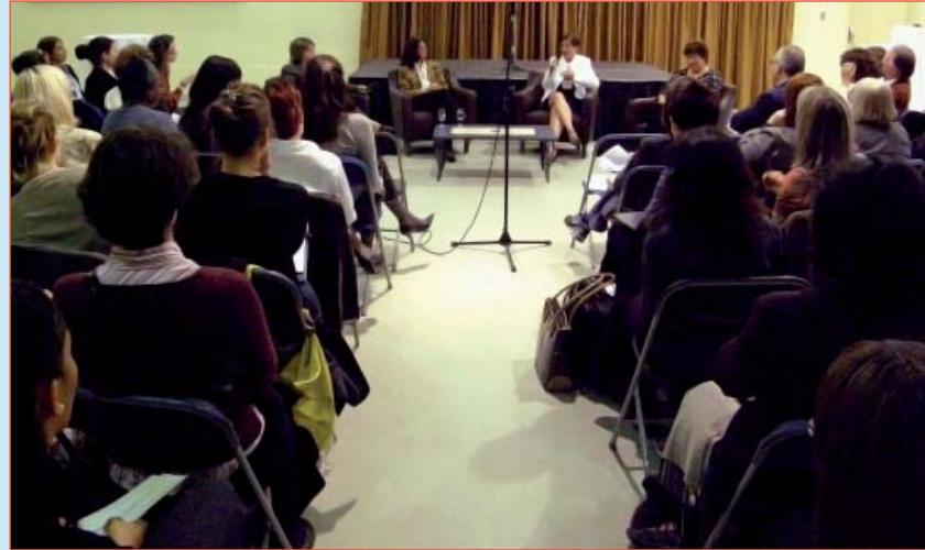
Le panel Rendez-vous Femmes Entrepreneures 2009